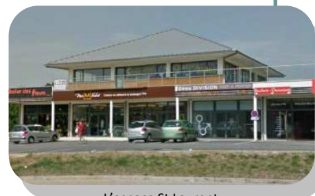
L'espace St Laurent