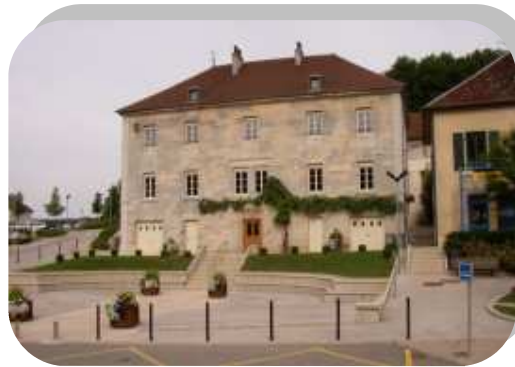
La mairie, au centre du village